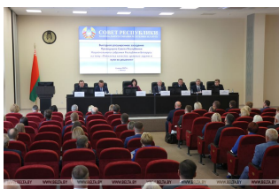
Заседание объединило широкий круг участников: члены Президиума Совета Республики, руководство республиканских органов государственного управления, председатели областных и Минского городского Совета депутатов, заместители председателей областных исполкомов и Минского горисполкома, которые курируют вопросы промышленного комплекса, руководители предприятий реального сектора экономики, организационной системы Госстандарта, члены Молодежного совета при Совете Республики.