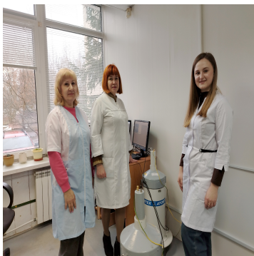
Такой обмен опытом позволяет повышать качество исследований и обеспечивать безопасность при работе на современном испытательном оборудовании.