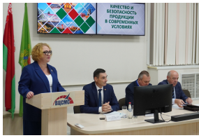
Мероприятие прошло 25 сентября 2025 г. и было посвящено теме «Тегиметка качества. Качество и безопасность продукции в современных условиях».

Цель семинара – совершенствование профессиональных компетенций по вопросам обеспечения качества и безопасности продукции, а также роли организаций системы Госстандарта в устойчивом развитии предприятий.