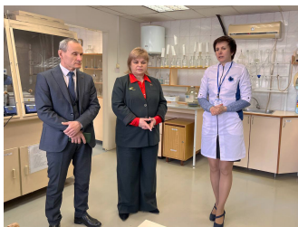
Акцент в отделе испытаний – определение показателей безопасности при помощи газо-жидкостной хроматографии, а также высокоэффективной жидкостной хроматографии, которая является на сегодня ключевым методом хроматографического анализа и одним из ведущих методов аналитической химии.

Также был продемонстрирован процесс поверки термометров, электросчетчиков, электроизмерительных средств измерений, термодатчиков. При этом был отмечен значительный объем приборов, находящихся в поверке, от предприятий – изготовителей Полоцкого региона.