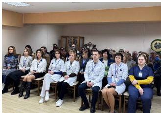
В ходе встречи руководитель комитета ознакомилась с направлениями работы предприятия, достигнутыми результатами и планами на перспективу.

Так, в отделе электромагнитных и теплотехнических измерений ей было продемонстрировано эксклюзивное оборудование для проверки приборов измерения концентрации паров алкоголя в выдыхаемом воздухе, позволяющее проводить поверку таких типов, как «Динго» и «Алкогобарьер» для предприятий всей республики.