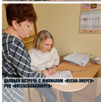
ДЕЛОВАЯ ВСТРЕЧА С ФИЛИАЛОМ «ВЕСНА-ЭНЕРГО» РУП «ВИТЕБСКЭНЕРГО»